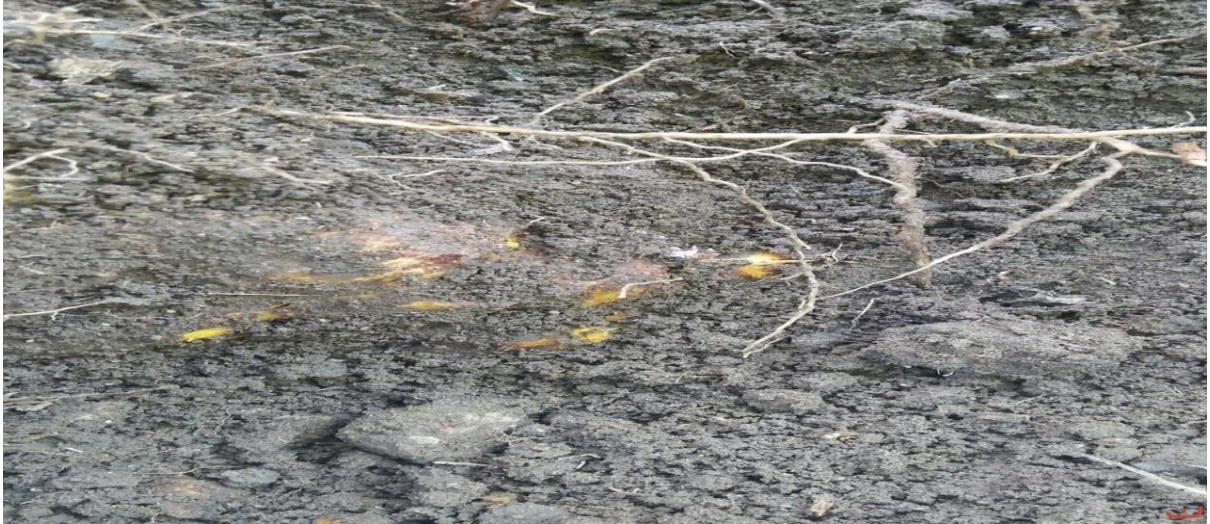
ประโยชน์ของราก รากมีสรรพคุณเป็นยาแก้เบาหวาน